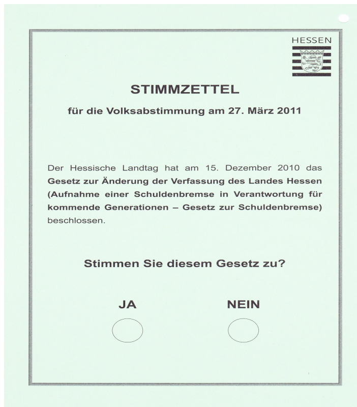
Abbildung 3. (Beiblatt der Kommunalwahl, eingescannt).